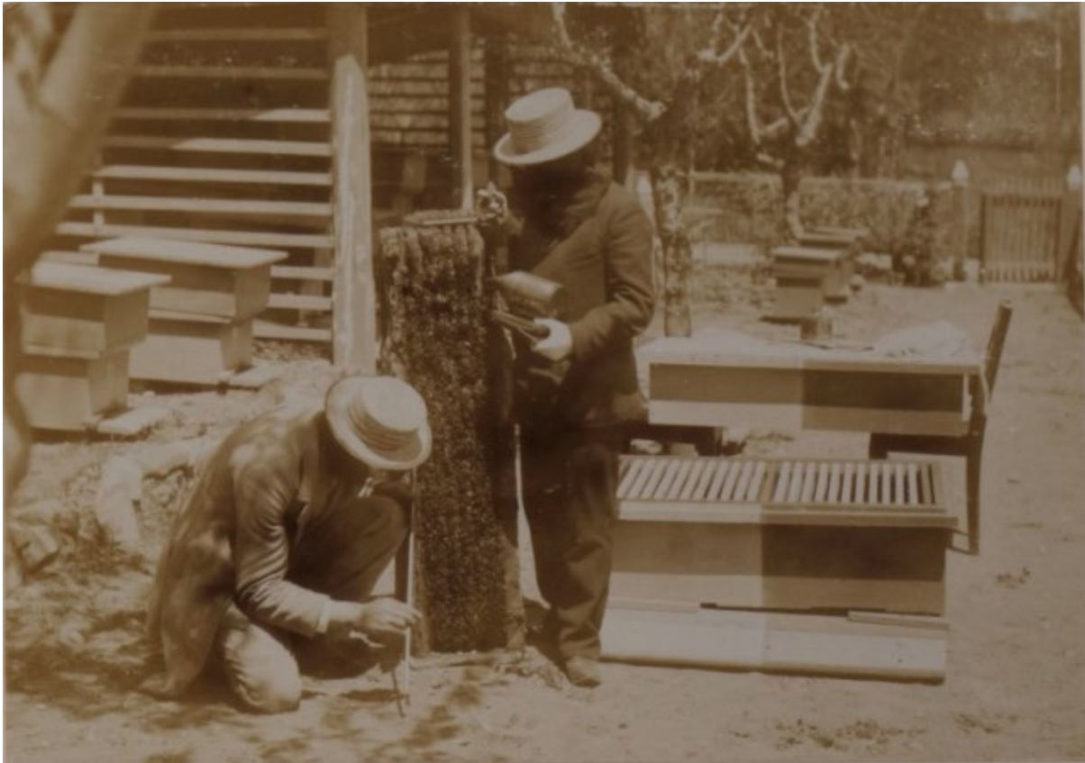
SP5002.129. პრაქტიკანტების მიერ ფუტკრის ნაყარის გადაყვანა ჩარჩოებიან სკაში კავკასიის მეაბრეშუმეობის სადგურში. თბილისი. 1893 წ. კონსტანტინე ზანისის ფოტო

კავკასიის მეაბრეშუმეობის სადგურში სამსახურის დატოვებიდან დიდი ხნის შემდეგაც, კონსტანტინე ზანისს ინტერესი ამ დარგის მიმართ არ დაუკარგავს. 1914 წლის იანვარში თბილისში მეფუტკრეების მცირე საკრედიტო ამხანაგობა დაარსდა. დამფუძნებელ კრებაზე გამგეობის თავმჯდომარედ კონსტანტინე ზანისი აირჩიეს. 47 ამხანაგობის კანტორა კავკასიის მეაბრეშუმეობის სადგურში იყო განთავსებული.