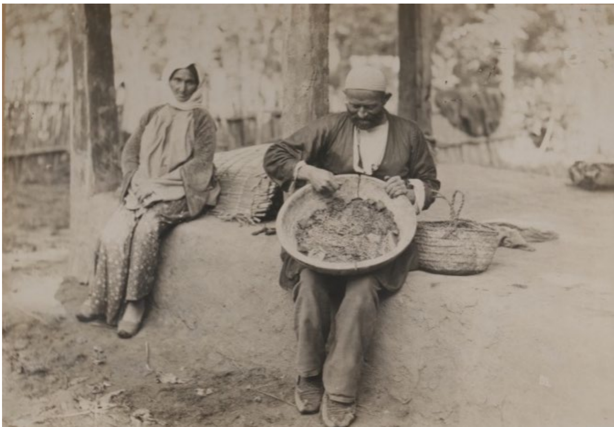
SP1124 . პირველი ასაკის ჭიის გამოკვება ადგილობრივი მეთოდით. მაშთალა, აზერბაიჯანი. 1892 წ.

განსხვავებით საქართველოში არსებული სხვა ადრინდელი და მოგვიანებით გახსნილი საზოგადოებებისგან, ტფილისის ნატიფ ხელოვნებათა საზოგადოება ღია იყო არა მხოლოდ პროფესიონალი მხატვრებისთვის, არამედ ადამიანებისთვის, რომლებსაც სხვადასხვა სახის შეხება ჰქონდათ