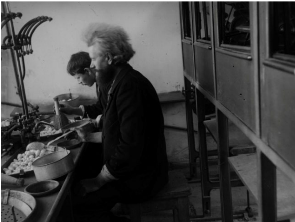
SP7145. ძაფის ამოხვევა იტალიურ ორთქლის დაზგებზე კავკასიის მეაბრეშუმეობის სადგურში. თბილისი. 1893 წ.

გამოფენებსა და კონკურსებზე, რომლებზეც კავკასიის მეაბრეშუმეობის სადგური უცხოეთისა თუ რუსეთის იმპერიის მასშტაბით მონაწილეობდა, მის მიერ ექსპონირებულ სადემონსტრაციო მასალებს შორის თითქმის ყოველთვის იყო ფოტოსურათები. სადგურის შენობების ექსტერიერებისა და ინტერიერების, ბაღების, ტფილისსა და ზოგადად კავკასიის მეაბრეშუმეობისა და მეფუტკრეობის მეურნეობების, სადგურის სამუშაო პროცესის ამსახველი ფოტოები, რომელთა მნიშვნელოვანი ნაწილი სწორედ კონსტანტინე ზანისის მიერ იყო გადაღებული, წარდგენილ იქნა შემდეგ გამოფენებზე: მოსკოვის ზოოლოგიური და ბოტანიკისა და აკლიმატიზაციის გამოფენები (1892), კოლუმბის საერთაშორისო გამოფენა ჩიკაგოში (1893), სრულიად რუსეთის მეფუტკრეობის გამოფენა სანკტ-პეტერბურგში (1893), სრულიად რუსეთის მეხილეობის გამოფენა (1894), სრულიად რუსეთის სამხატვრო-საწარმოო გამოფენა ნიჟნი-ნოვგოროდში (1896), კიევის სასოფლო-სამეურნეო და საწარმოო გამოფენა (1897), პარიზის მსოფლიო გამოფენა (1900), მეფუტკრეობის საერთაშორისო გამოფენა ლანში (1901), კავკასიის სასოფლო-სამეურნეო და საწარმოო საიუბილეო გამოფენა ტფილისში (1901), სრულიად რუსეთის სამრეწველო-კუსტარული გამოფენა (1902), მემცენარეობის პირველი გამოფენა გაგრაში (1903). 22