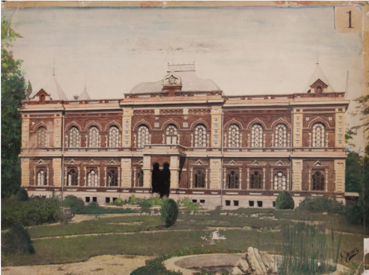
SP1001. კავკასიის მეაბრეშუმეობის სადგურის მთავარი შენობის წინა ფასადი (რეტეშირებული). თბილისი. 1892 წ.

მუშაობისას, ლაბორატორიის გამგემ, კონსტანტინე ზანიშვილმა, 1891-1903 წლებში, სადგურის სხვა სამუშაო მოვალეობების შესრულების პარალელურად, დიდძალი ფოტოგრაფიული მემკვიდრეობა შექმნა.