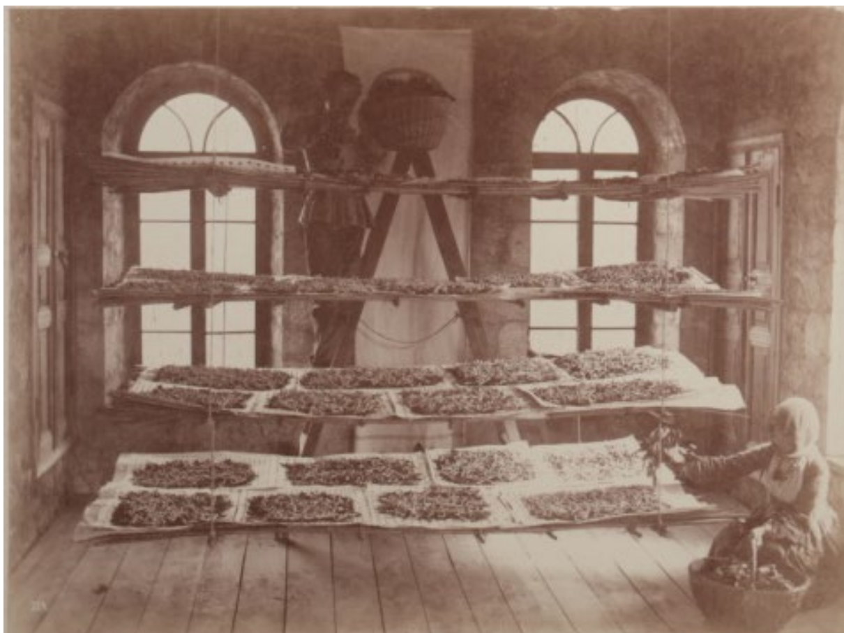
SP1101. აბრეშუმის ჭიების გამოკვება კავკასიის მეაბრეშუმეობის სადგურის შუშის განყოფილებაში. სეიდლუ, ზემო ყარაბაღი. 1893 წ.

ზანისის მდიდარი შემოქმედებითი მემკვიდრეობა მეტყველებს, თუ რამდენად ინტენსიურად იყენებდა იგი ფოტოგრაფიის მედიუმს სხვადასხვა მოვლენის თუ გარემოების ვიზუალური დოკუმენტირების პროცესში. ამავდროულად, მისთვის ფოტოგრაფია მხატვრული თვითგამოხატვის შესაძლებლობა იყო. ზანისის