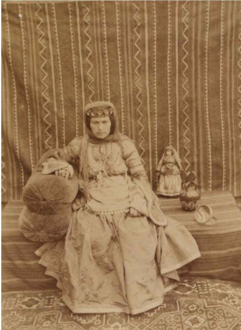
SP1277. ახალგაზრდა სომეხი ქალი აბრეშუმის ნაციონალურ სამოსში. შემახა, აზერბაიჯანი. 1893 წ.

ფიგურები არ არიან. მათი გამოსახულება ფოტოგრაფის მზერას ირეკლავს და ავტორის ეთნოგრაფიულ ინტერესზე მიგვანიშნებს. ამ ფოტოებით ზანისი, მეფუტკრეობასთან და სოფლის მეურნეობასთან დაკავშირებული საკითხების გარდა, კავკასიის მკვიდრ მოსახლეობას აკვირდება, გარედან სწავლობს მათ ხასიათებს და კულტურულ ნიშან-თვისებებს, რომლებსაც მეურნეობების განვითარებაში გარდამტეხ, ხშირად არაპოზიტიურ მნიშვნელობას მიაწერს. ფოტოების აღწერებსა თუ მოგზაურობების შესახებ დაწერილ ანგარიშებში მეურნეობებში ჩართულ ადამიანებს ზანისი იმ დროისთვის არსებული იმპერიული ლექსიკონით მოიხსენიებს – „туземец туземный“.