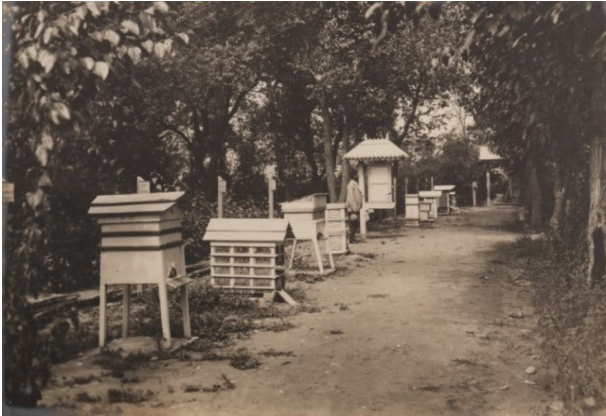
SP5001.24. სხვადასხვა სისტემის სკები კავკასიის მეაბრეშუმეობის სადგურის სასწავლო საფუტკრეში. თბილისი. 1900 წ.

ანატომიური და ბიოლოგიური კოლექცია შექმნა, რომელმაც სათავე დაუდო საფუტკრის სხვა კოლექციებსა და სათაფლე მცენარეების ჰერბარიუმს.