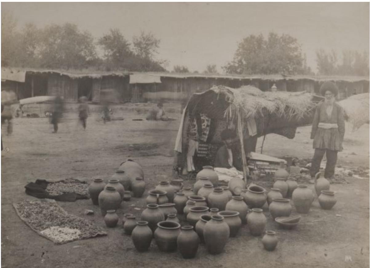
SP1286. პარკის გამყიდველი თათრები. აღდაში, აზერბაიჯანი. 1892 წ.

მუზეუმი ფოტოგრაფიას რამდენიმე მიმართულებით იყენებდა, კერძოდ, როგორც საკუთარი საქმიანობის დოკუმენტირების, ისე სადგურში მიმდინარე სამუშაოების შესახებ ადგილობრივად თუ უცხოეთში ინფორმაციის გავრცელების, მეაბრეშუმეობისა და მეფუტკრეობის პოპულარიზაციისა და საგანმანათლებლო მიზნების მისაღწევ საშუალებას.