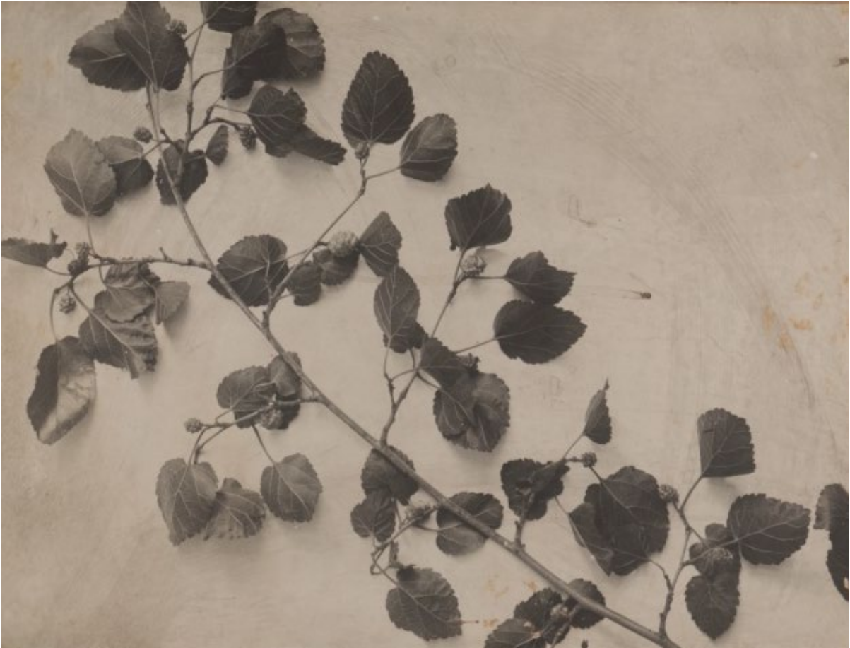
SP1056. თუთის ტოტები ველური თეთრი ნაყოფით. 1900 წ. კონსტანტინე ზანისის ფოტო

მეაბრეშუმეობის სადგურზე მუშაობის პერიოდში ზანისი უშუალოდ იყო ჩართული გამოფენა-კონკურსების ორგანიზებაშიც. მის მიერ მოეწყო მეაბრეშუმეობის პროდუქტების გამოფენა-კონკურსი დრანდაში 1898 წელს, 33 მეაბრეშუმეობის პროდუქტების გამოფენა-კონკურსი სოხუმსა და ნახიჩევანში (ერევნის გუბერნია) 1899 წელს. 34