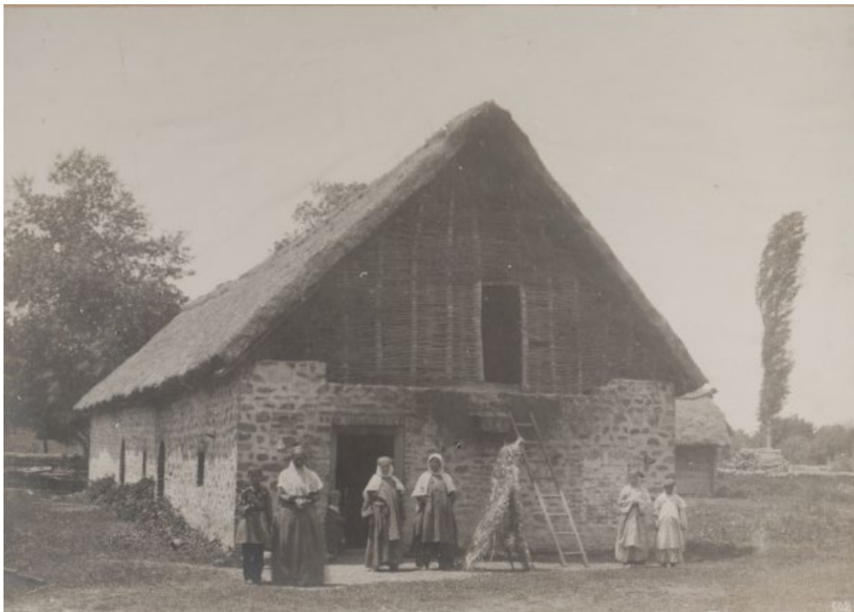
SP1085. ადგილობრივი საჭიე ნაგებობა. ბელაქანი, აზერბაიჯანი. 1895 წ.

კონსტანტინე ზანისის გარდა, 1888–1907 წლებში, სხვადასხვა დროს, სადგურში ფოტოგრაფიულ საქმიანობას ეწეოდნენ სადგურის ხელმძღვანელი ნიკოლაი შავროვი და თანამშრომლები: გრიგოლ სუნდუკიანი 16 , ვლადიმირ ივანოვი 17