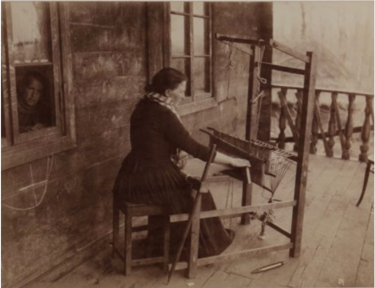
SP1246. აბრეშუმის დარაიას ქსოვა ადგილობრივ დაზგაზე. ბახვი, საქართველო. 1893 წ.

(დღევანდელი აღდაშის რაიონი) და ნუხის (დღევანდელი შაქის რაიონი) მაზრებსა და ზაქათალის ოლქში გაემგზავრა. 28